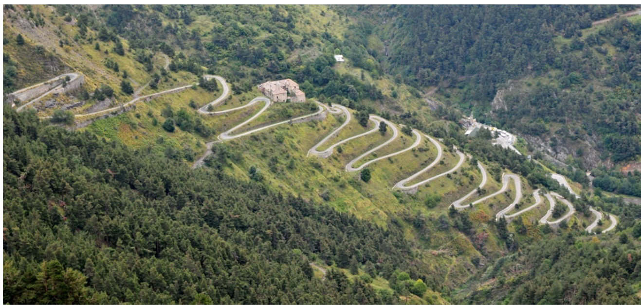
Piste qui relie le col de Tende dans la vallée de la Roya

La circulation est autorisée pendant les mois estivaux, après la fonte des neiges, et en automne aux randonneurs pédestres, VTT et véhicules tous terrains. Les mardis et jeudis sont réservés uniquement aux piétons et cyclo-sportifs. Le trafic et les bivouacs de nuit sont interdits et une contribution de 15,- EUR aux dépenses de gestion de la piste est perçue pour le passage.